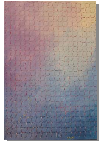
"Astuto" 50x70 Technica mista, materico, olio su tela. 2001