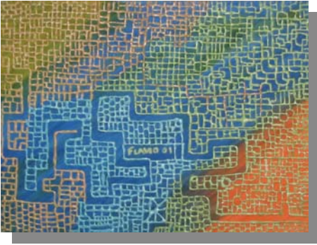
"Corri spondenze" 40X30 Tecnica mista, materico, olio su tela, 2000