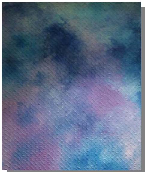
"Texture" 50x70 Tecnicamista, materico, olio su tela, 2001

Ritiene TRATTI DISCONTINUI l'ingegno e la virtù, le chiavi della modernità, certo. Ma la pittura esige altrettanta virtù e altrettanto ingegno dell'architettura, ed è più libera, in quanto il pittore può plasmare i suoi sogni e l'architetto dipende da come gli altri vogliono e debbano vivere.