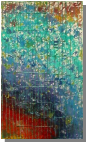
"Sorgente" 70x40 Technica mista, materico, olio su tela, 2001. Mihajli 2004

RITIENE TRATTI DISCONTINUI che la personalità sia il risultato di una somma interminabile e come operazione aritmetica, non sembra essersi lasciata nulla