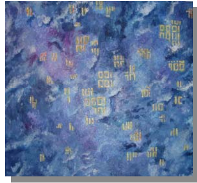
"Aforismi Digitali" trittico volumetrico 120x80x2 40x80 Technica mista, materico, olio su tela, 2002

LUDMILLA SOSTIENE che gli autori è meglio non conoscerli di persona, perché la persona reale non corrisponde mai all'immagine che si fa guardando i quadri, direi che potrebbe essere la mia osservatrice ideale se esistesse, questa Ludmilla.