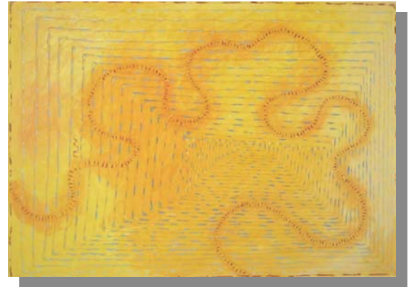
"Le Vie Del Giallo" 60X40 Tecnica mista, materico, olio su tela, 2001. Libreria del Giallo 2003

IL RESTO non aveva senso, perché sapeva che quanto più lontano uno si spinge quando pinta, tanto più solo si ritrova. E alla fine uno impara a difenderla, la sua solitudine: parlare di pittura è una perdita di tempo, e se si è soli tanto meglio perché è da soli che si lavora, e perché il tempo per lavorare è sempre di meno e se lo si spreca poi si sente di essersi macchiati di una colpa imperdonabile.