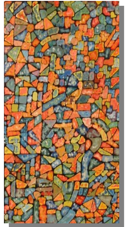
"Uno" 40x80 Tecnica mista, materico, olio su tela, 1995