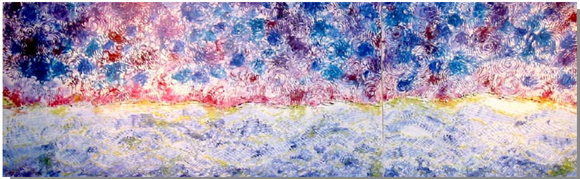
"Contraddittorio" Politti co volumetrico 80x40 40x40 Tecnica mista, materico, olio su tela , 2002