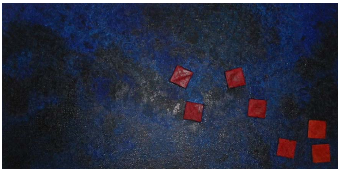
"Di spersi one" 200x100 Tecnica mista, materico, olio su tela, 2002