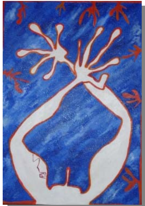
"Braccia Accese" 100x70, Tecnica mista, materico, acrilico su tela, 2004.

Se non Vi siete lasciati intimidire, fatevi forza e procedete nella lettura. Probabilmente resterete disgustati dalle immagini senza connessioni con gli scritti o sarete sedotti dagli scritti, i più metodici cercheranno tra la bibliografia e il testo (LIBERAMENTE TRATTI), gli altri cercheranno di non perdere il filo del discorso tra un paragrafo e l'altro. Gli ultimi, o i primi, cercheranno di costruire da sé le connessioni tra i vari scritti e le immagini, daranno spazio all'immaginazione e costruiranno percorsi alternativi, perché anche la lettura e l'osservazione di un quadro hanno una propria dimensione creativa. ☺