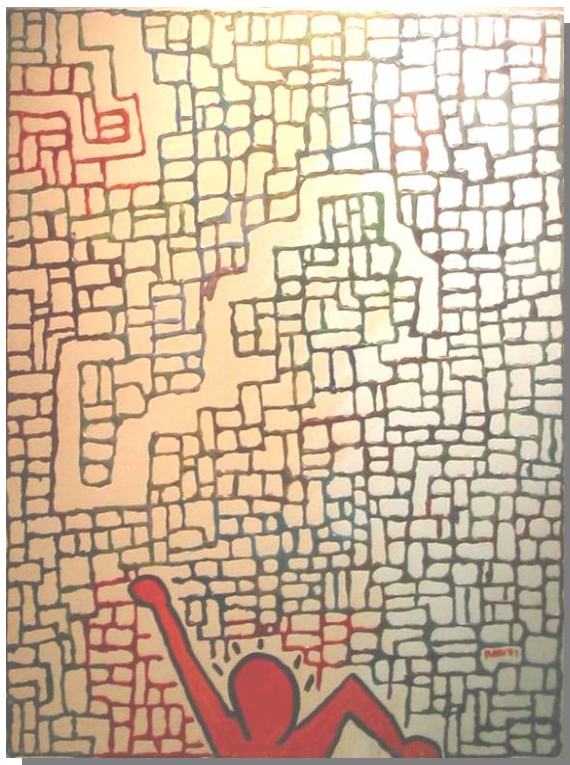
"Tributo Irriverente a a KEITH HARING" 40x50, Tecnica mista, materico, olio su tela, 2002. Asta a favore della Libreria del Giallo, 10. 2003

Pelagie, perché, per la prima volta, ebbe l' impressione di percepire la linea di discontinuità . Due termini contraddittori, che racchiudono un paradosso ma che esprimono, in parte, il tema della esperienza pittorica maturata, i TRATTI DI SCONTI NUI .