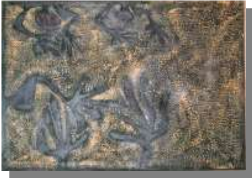
Progetto "Le Mie Braccia", serie di quadri a tema: Braccio Deserto 100x70, Tecnica mista, acrilico su tela. Presentato Euromercato Gallarate. Giugno 2005