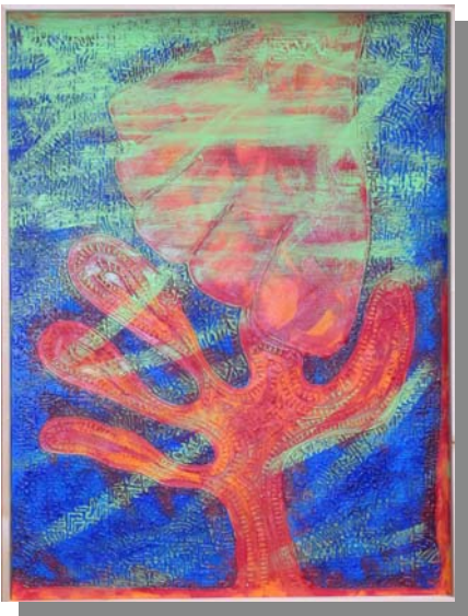
"Ubi Maior" 80x60 Tecnica mista, materico, acrilico su tela, 2004. Progetto "Le Mie Braccia" , Simona Viborgi

HO ADOTTATO, trasformato, interpretato, contaminato e decontestualizzato le parole scritte dagli autori citati per aiutare chi osserva le mie tele affinché possa dotarle di significati che vadano oltre le apparenze e per stimolare una lettura delle sensazioni che riescono a provocare.