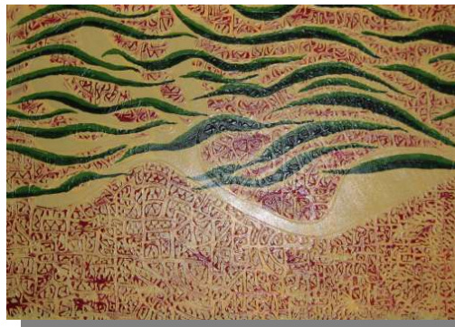
Confuse e Fresche 100x70, Tecnica mista, acrilico su tela. Presentato Luglio Landrianese, Luglio 2005