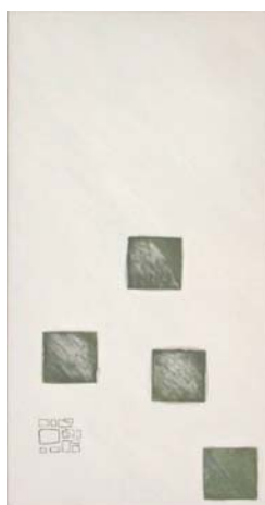
"Bianco" 80x40 Tecnica mista, olio su tela, 2001