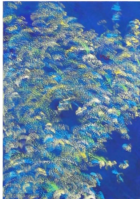
Progetto "Le Mie Braccia", serie di quadri a tema: da sx alto: Braccio Verde 100x70; Braccio e alghe, 100x70. Presentati Euromercato Gallarate. Giugno 2005