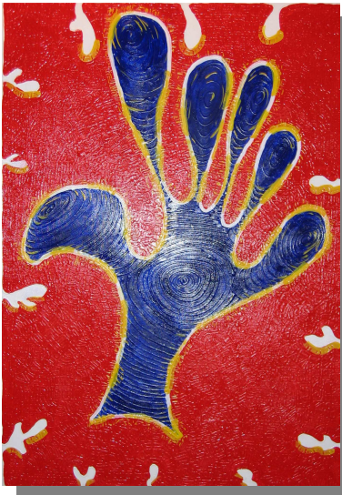
"Mano libera" 100x70 Tecnica mista, materico, acrilico su tela, 2004, prog. XXIV maggio