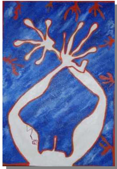
"Braccia Accese" 100x70, Tecnica mista, materico, acrilico su tela, 2004.