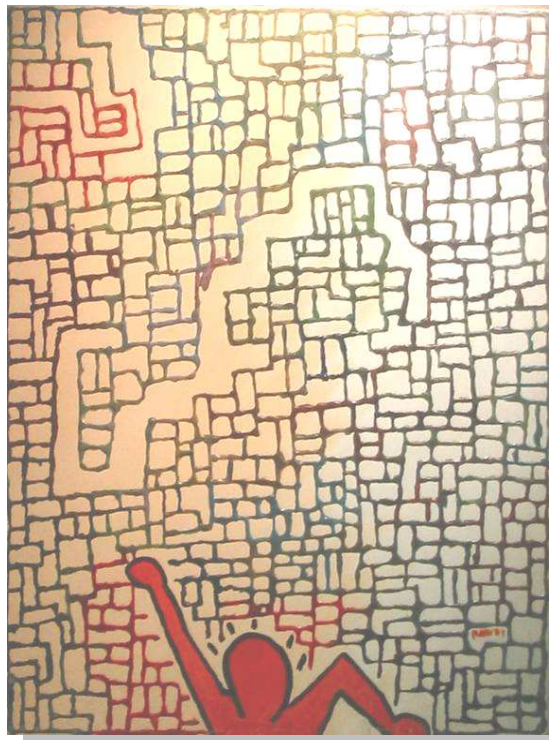
"Tributo Irriverente a KEITH HARING" 40x50, Tecnica mista, materico, olio su tela, 2002. Asta a favore della Libreria del Giallo, 10.2003

Ciò avveniva attraverso simbolismi, metaprogetti e archetipi di ordine geometrico-smemorandeschi.