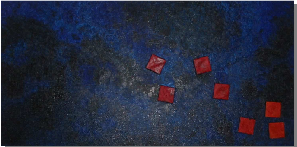
"Dispersione" 200x100 Tecnica mista, materico, olio su tela, 2002