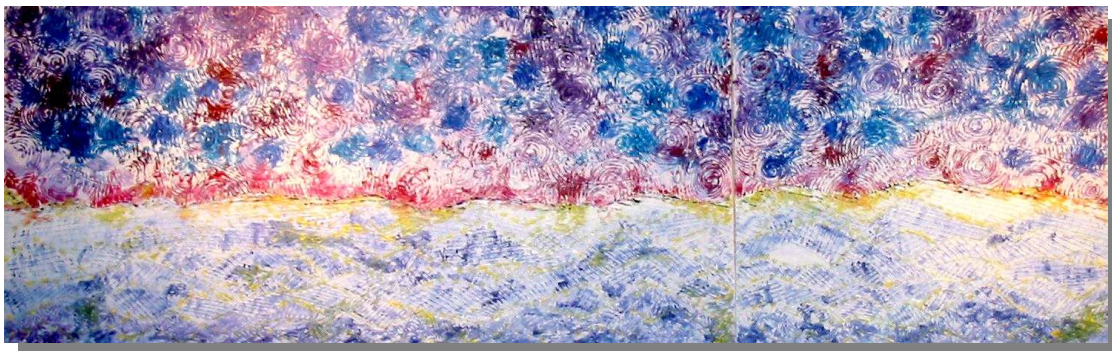
"Contraddittorio" Polittico volumetrico 80x40 40x40 Tecnica mista, materico, olio su tela, 2002 Vanessa castano e Matteo Tresoldi